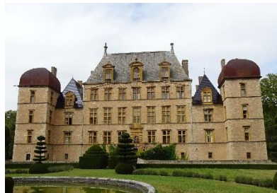
Château de Fléchères, ses fresques