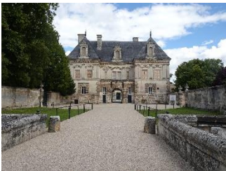
Château de Tanlay