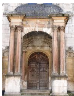
Dijon, porte du Palais de Justice sculptée par Sambin