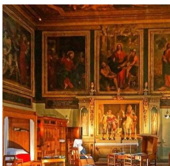
Beaune Hôtel-Dieu Isaac Moillon