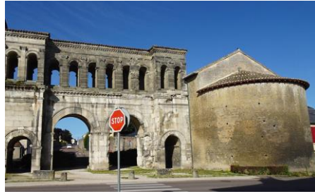
Autun, porte Saint-André