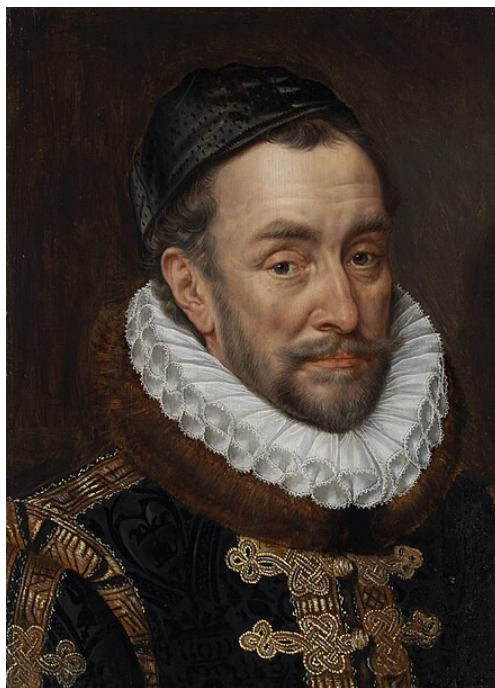
Devise de Guillaume de Nassau, 1533-1584