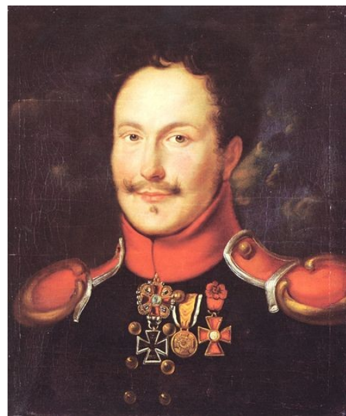
La Motte-Fouqué en tenue de Hussard

famille saintongaise dont le plus illustre représentant est le célèbre poète du romantisme allemand Frédéric de La Mothe-Fouqué 1777-1843 l'auteur de Ondine